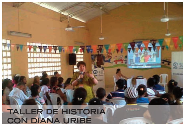
TALLER DE HISTORIA CON DIANA URIBE

Se trata de un proyecto continuado que se lleva a cabo a lo largo del año, a través de nuestra colaboración con entidades locales. Nuestro socio principal es la Fundación PLAN International.