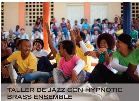
TALLER DE JAZZ CON HYPNOTIC BRASS ENSEMBLE