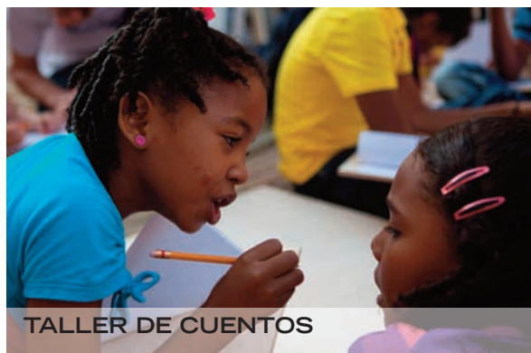
TALLER DE CUENTOS