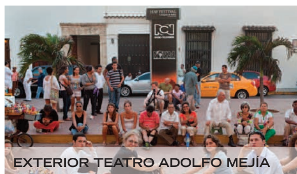
EXTERIOR TEATRO ADOLFO MEJÍA