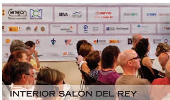
INTERIOR SALÓN DEL REY